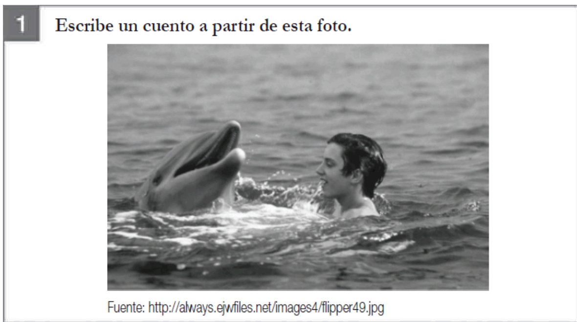
Figura 1. Tarea para escribir un cuento (texto narrativo), prueba SIMCE escritura 2008 (MINEDUC, 2009)

La segunda tarea consistió en la escritura de una carta de solicitud, motivada por la instrucción Tu curso juntó plata para ir de paseo. Te eligieron para convencer al director de la escuela de que les dé permiso para ir. Escribe una carta al director de tu escuela para convencerlo de que les dé permiso para ir de paseo (ver figura 2).